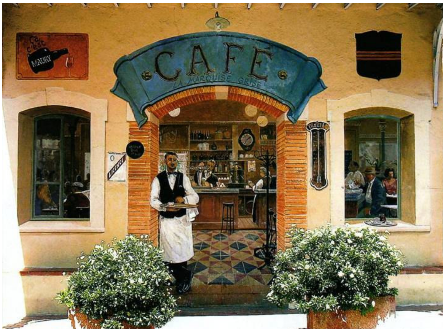
A l'angle de la rue menant à la mairie, se dresse le grand café « La marquise grise » où aiment se rencontrer les habitants...